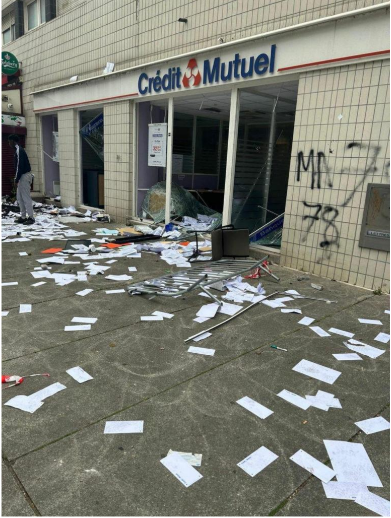
Nanterre'deki beyaz yürüyüşün neticesi, 29 Haziran