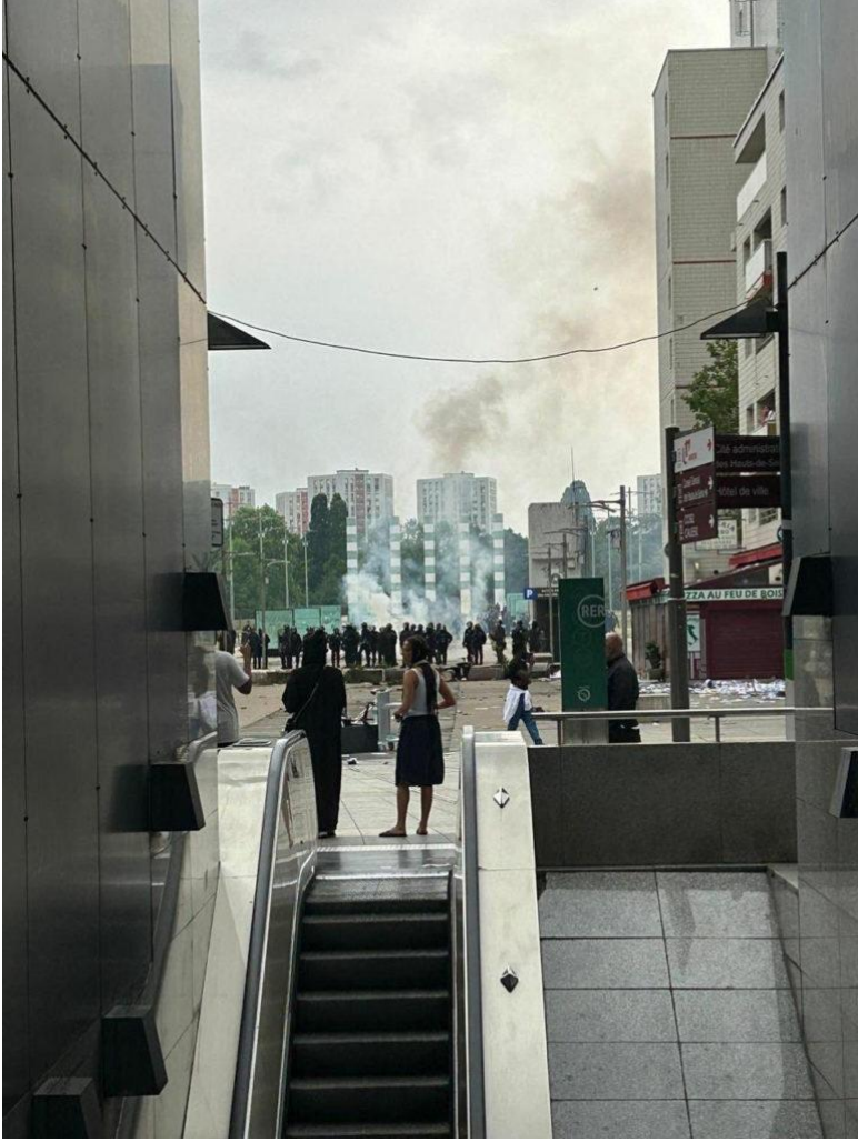
Nanterre'deki yürüyüşün ardından, 29 Haziran