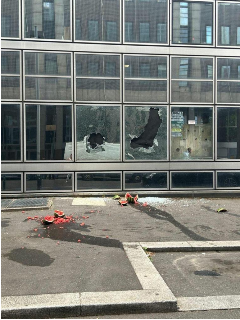
Nanterre'deki beyaz yürüyüşün neticesi, 29 Haziran